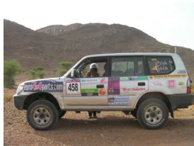
« Chouquette » Notre 4x4 TOYOTA KDJ 95 Land Cruiser

Notre Association Les Enfants du Désert Marocain , association à but non lucratif, A pour objet de récolter des fonds à but humanitaire pour transporter du matériel d'hygiène et médical à l'aide du trophée « Roses des Sables ».